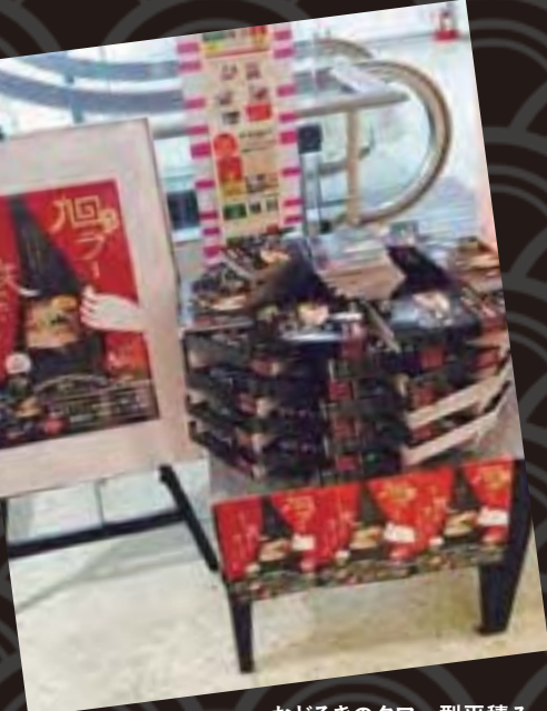
おどろきのタワー型平積み (ジュンク堂書店様)