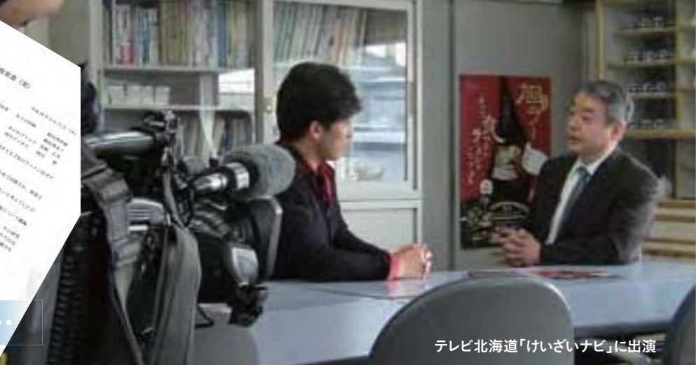
テレビ北海道「けいざいナビ」に出演