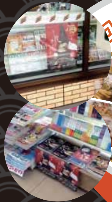
異例の直販で置いてくれたセブンイレブン様

また3月には新しい情報も加えた増補版の発行も予定しております。 その節には同様のお引き立てのほどお願い申し上げます。