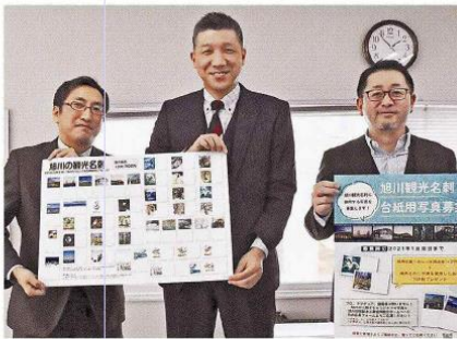
「旭川のオリジナル写真を送って」と呼びかける同組合のメンバー

市職協が共同で発行。市職員や市民らに親しんでいる。旭山動物園のペンギンや旭橋などの図柄が人気で全53種類を展開。写真が古くなったことから、リ