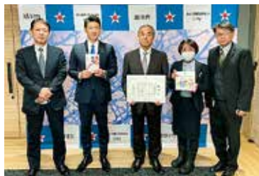
左から、坂野専務理事、今津旭川市長、植平理事長、利根川事業委員会委員長、山田副理事

化する。今において、指先を使った遊び「おりがみ」が子どもたちの遊びの一つに加われば幸いです。